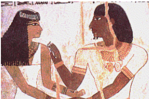
Egyptský manželský pár po smrti

Ženy si neberú svoju silu späť, ony ju nikdy nemali. Historické obdobie, v ktorom ženy mali autoritu, je dnešku naozaj veľmi vzdialené. Bolo to dávno pred tým, čo dnes voláme dejiny, v prehistorických časoch zahalených hmlami a legendami. Jedny z posledných, o ktorých sme počuli, boli Amazonky, národ bojovníčok, z obdobia medzi dobou kamennou a bronzovou, ktoré sa zúčastnili bojov o Tróju pred cca. 4000 rokmi. Ešte aj v starom Egypte bol vzťah medzi mužom a ženou skoro rovnocenný.