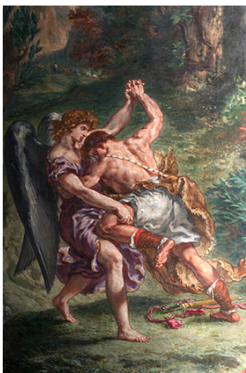
(Jakub zápasí s anjelom, Eugene Delacroix, fáza 1: zápas) 2: požehnanie)

Jakub sa postaví zoči voči svojmu Dvojníkovi vo forme Temného anjela (knihy Genézy 24), ktorý mu bráni prekročiť rieku Jordán na ceste do zaslúbenej zeme. Pasujú sa celú noc a keď nadíde ráno, Anjel temnoty prosí Jakuba, aby ho pustil, pretože neznesie svetlo. Jakub odmieta, kým mu anjel nepožehná. Jakub prinútil (!) anjela dať mu nové iniciačné meno Izrael spolu s jeho významom: „pretože si statočne zápasil s ľuďmi a Bohom a premohol si ich“.