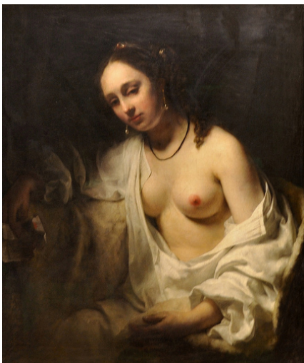
(Batšeba s listom od kráľa Dávida, Willem Drost 1654)

Do určitej miery sa človek medzi týmito možnosťami môže rozhodovať na základe spirituálnej sily, ktorú už väčšina ľudstva dosiahla, a síce na základe Súcitú, Logiky a Svedomia . Ako som písal v predošlom článku, sú tri veci, ktoré majú ľudia, ale Dvojník nie: Srdce, Pravdu a Slobodu. Dvojník je vo svojej podstate protiklad k týmto trom: bezcitný a bez srdca, nenapraviteľný klamár a predvídateľný manipulátor. Duchovná dimenzia ľudského srdca je súciť : impulz k tomu, že nám na iných záležitostiach, chceme im pomôcť, či zmierniť ich utrpenie. Duchovná dimenzia ľudskej pravdivosti je logika : objektívne kritérium pravdivosti argumentu, domnienky, vysvetlenia či dôvodu k činu. Duchovná dimenzia ľudskej slobody je svedomie : vnútorný kompas ukazujúci rozdiel medzi morálnym a nemorálnym činom. Všetky tri môžeme použiť predtým, ako začneme konať, ale aj potom.